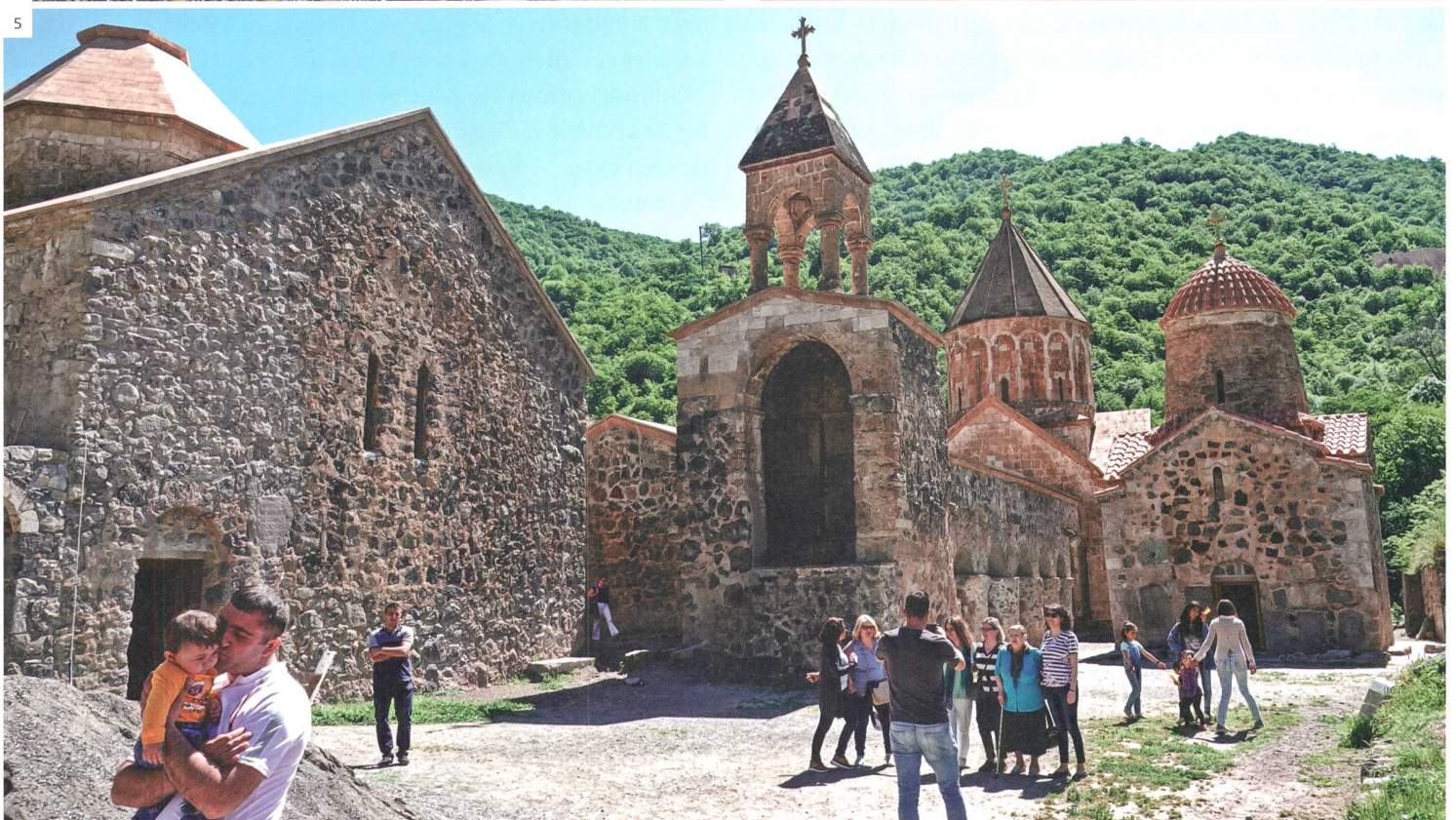
1) Howanots-Wasserfälle im Hunot Canyon. 2) Frauen auf dem Markt bereiten Dschingalow Hats zu. 3) Fleisch am Spiess: das berühmte armenische Chorowats. 4) Heisse Thermalquellen in der Region Karwatschar. 5) Touristen besichtigen das Kloster Dadiwank. Bilder: Stephan Bader (1, 2, 4), Ronnie Grob (3), Lukas Rühli (5).