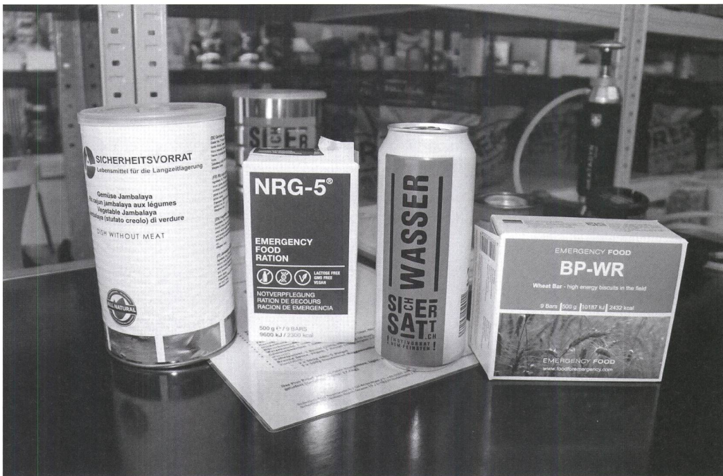
Produkte fürs Überleben, z.B. Gemüse, das 15 Jahre haltbar ist (Dose ganz links), fotografiert von Laura Clavadetscher.