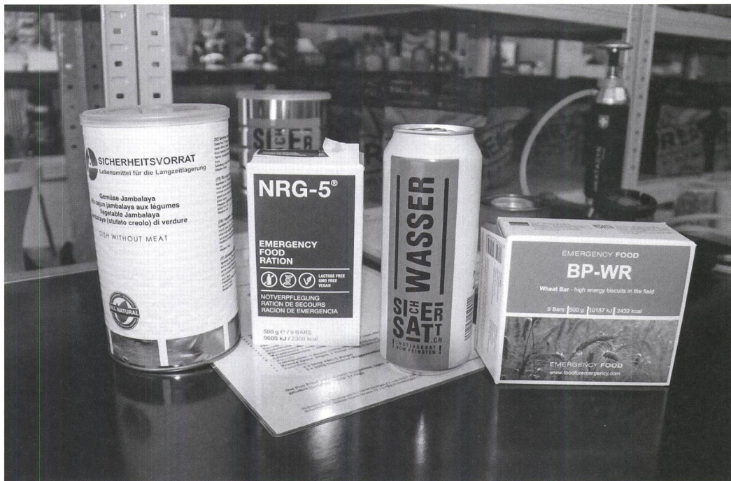
Produkte fürs Überleben, z.B. Gemüse, das 15 Jahre haltbar ist (Dose ganz links), fotografiert von Laura Clavadetscher.