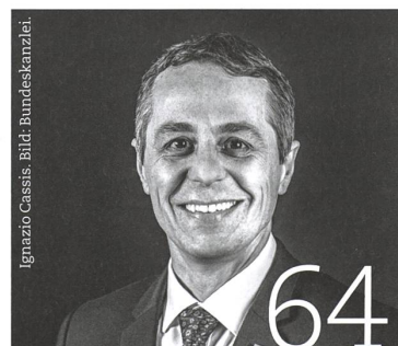
Ignazio Cassis.