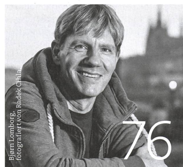
Bjørn Lomborg