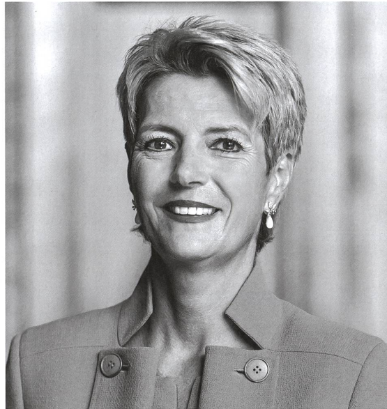
Karin Keller-Sutter.

Dabei müssen wir uns konsequent auf den freien und verantwortungsbewussten Menschen ausrichten. Als Richtschnur gelten dabei die liberalen Grundsätze: Privat kommt vor Staat, Erwirtschaften vor Verteilen und Freiheit vor Gleichheit. Mehr Freiheit hat aber nur dann Sinn, wenn gleichzeitig darauf geachtet wird, dass die sozialen Bindungen in unserer Gesellschaft tragfähig bleiben.