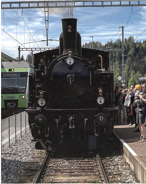
Dampflok Ed 3/4 Nr. 2, fotografiert von Nicolas A. Rimoldi.