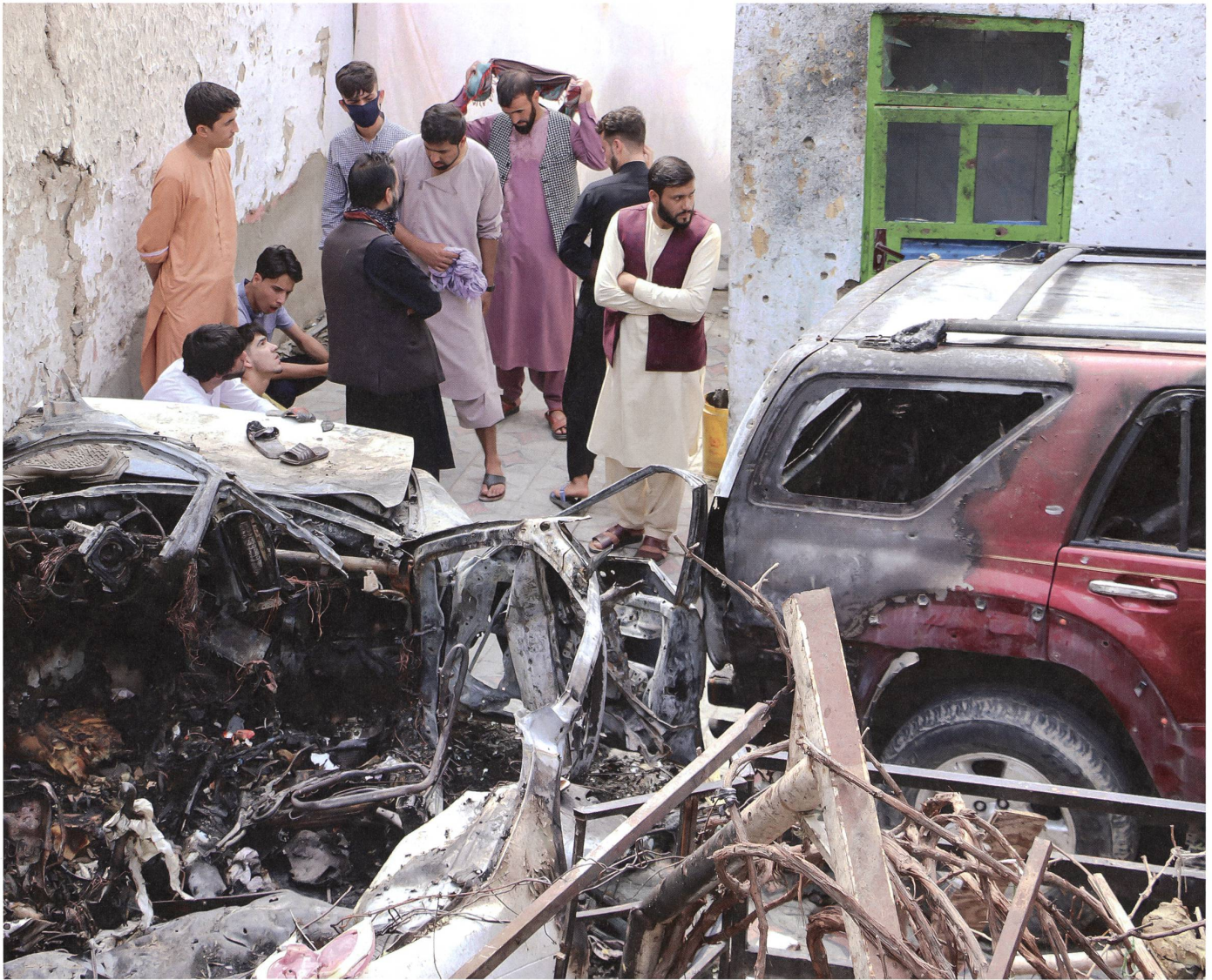
Am Tag nach dem US-Drohnenangriff vom Sonntag, 29. August 2021, versammeln sich in Kabul Einwohner und Familienangehörige der Opfer neben dem beschädigten Fahrzeug.

«Durch die Kombination von Eigenschaften wie Geschwindigkeit, Präzision, Anpassungsfähigkeit und Distanziertheit üben Drohnen eine nahezu unwiderstehliche Anziehungskraft auf politische Entscheidungsträger aus – ohne dass sich diese dessen bewusst sind.»