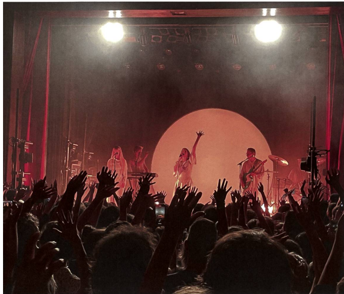
Hände zum Himmel: Aurora und Band im Zürcher Lokal Kaufleuten, fotografiert von Daniel Jung.