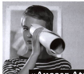
Jean Seberg als Patricia Franchini in «Ausser Atem» von Jean-Luc Godard, 1960.

Zudem hat die Sängerin Humor: Sie berichtet von einem Spa-Besuch in Zürich, wo sie die Gepflogenheiten bezüglich Nacktheit und Bekleidung verwirrt. Als sie ein Haar aus ihrem Mund fischt, berichtet sie von der Überladung ihrer Sinne. Als sie Fanpost von der Bühne einsammelt, verstaubt sie diese im Brustkörbchen ihres Kostüms. Die eingefleischten Fans liegen der jungen Frau sowieso zu Füssen. Doch sie holt auch die restlichen Besucher ab. (dj)