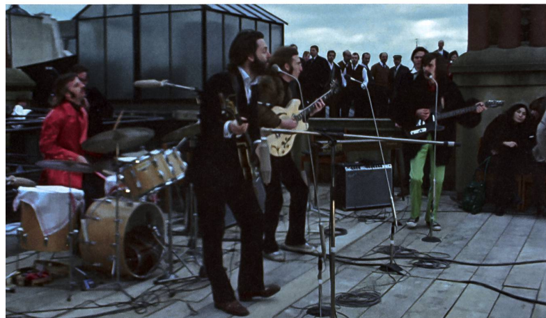
Die Beatles bei ihrem berühmten Dachkonzert, dem letzten Liveauftritt, am 30. Januar 1969.