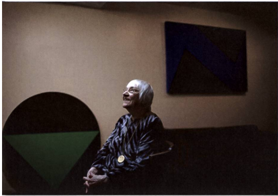
Carmen Herrera.