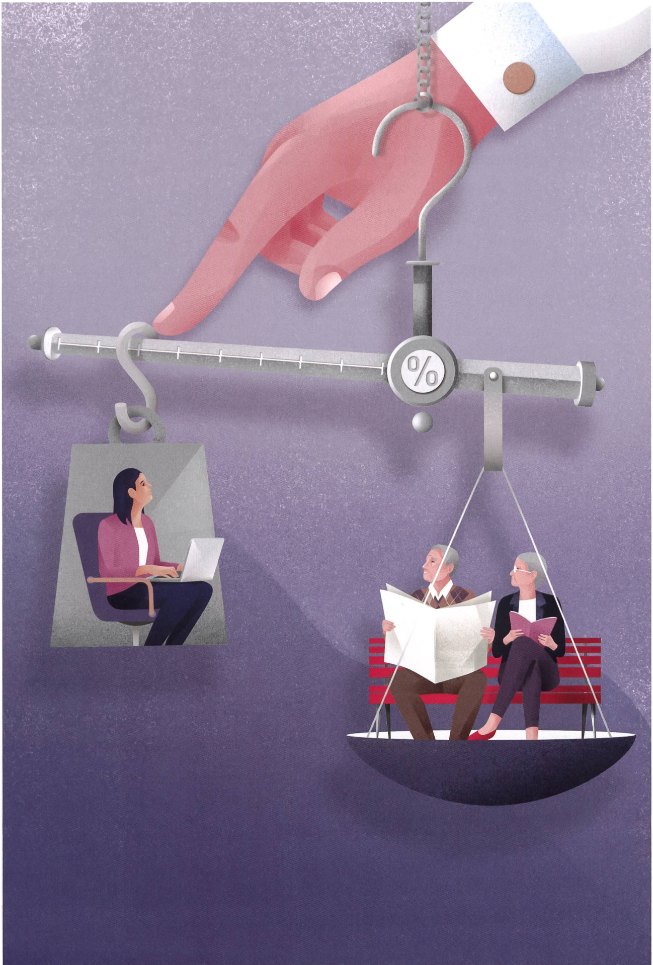
Illustration von Corina Vögele.