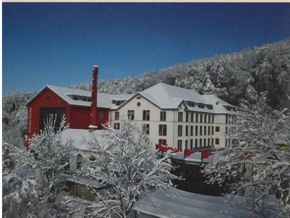
Hier findet der erste «Liberale Kongress Schweiz» statt: im Seminar- und Eventhotel Riverside in Glattfelden im Zürcher Unterland.