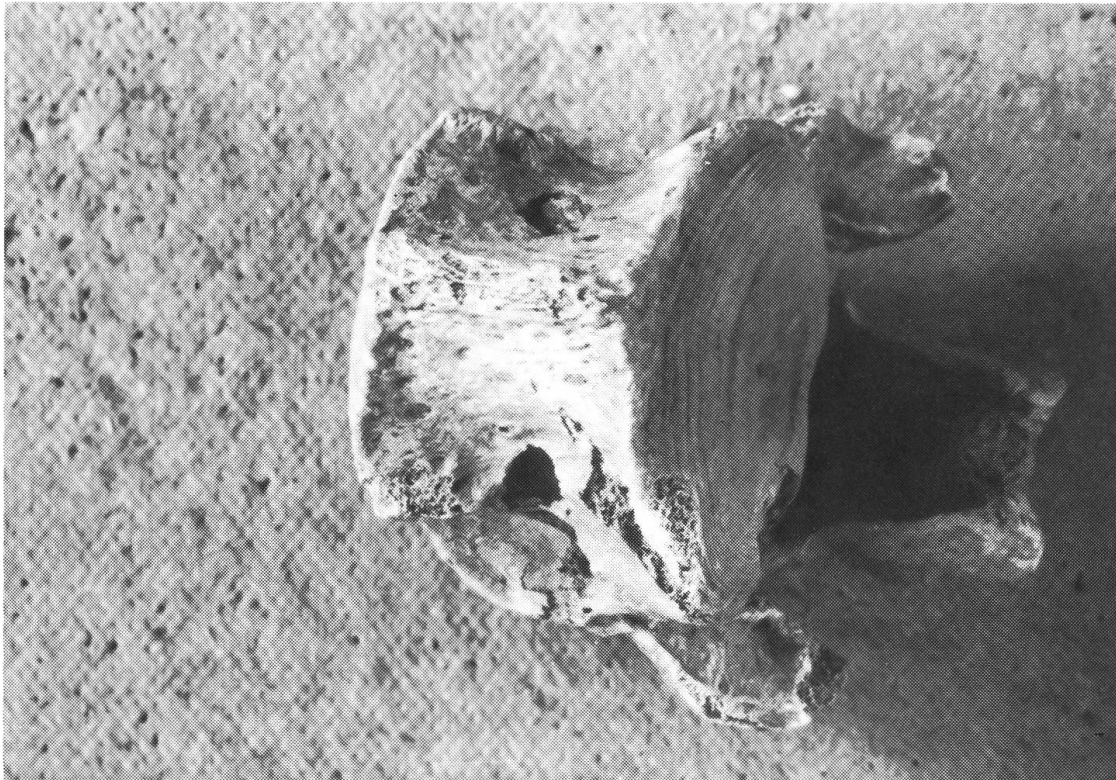
Fig. 3 Ursus spelaeus , vertebra dorsale proveniente dal livello 1. Si notano due punctures sui fianchi opposti della regione ventrale. Diametro del foro maggiore: 13 mm.