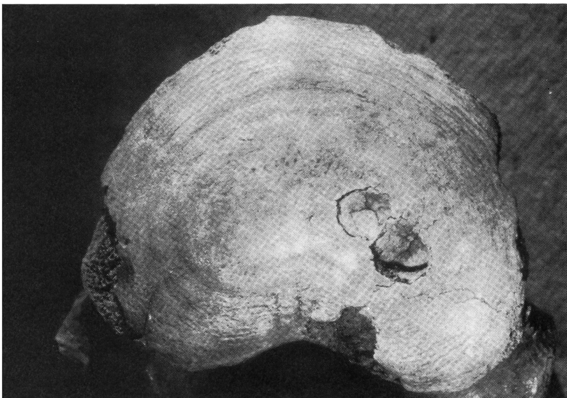
Fig. 5 Ursus spelaeus , vertebra lombare proveniente dal livello 2. Si osservano due fori sulla parete anteriore del corpo vertebrale; essi denotano una doppia debole presa. Diametro del foro maggiore: 7, 7 mm.

scuità nelle grotte; quindi vi potevano svernare contemporaneamente più individui anche di sesso diverso. Fenomeni di aggressione potevano quindi essere possibili e dar luogo a punctures sui crani. Escludendo questi ultimi, gli altri morsi devono essere stati inferti post-mortem.