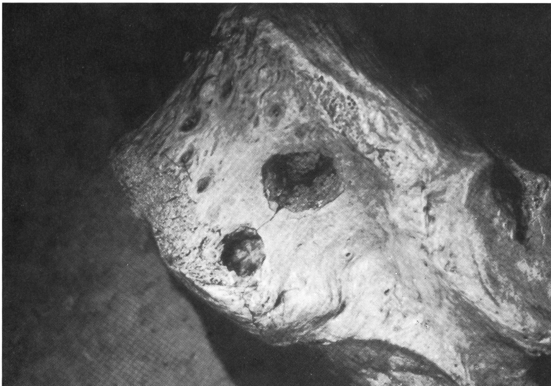
Fig. 4 Ursus spelaeus , vertebra dorsale proveniente dal livello 1. Si notano due fori affiancati inferti probabilmente da individui differenti. Il foro destro, più piccolo, è a fondo piatto, quindi inferto da un canino usurato, mentre quello sinistro, più largo, presenta il fondo appuntito collegabile ad un canino integro. Diametro del foro maggiore: 9 mm