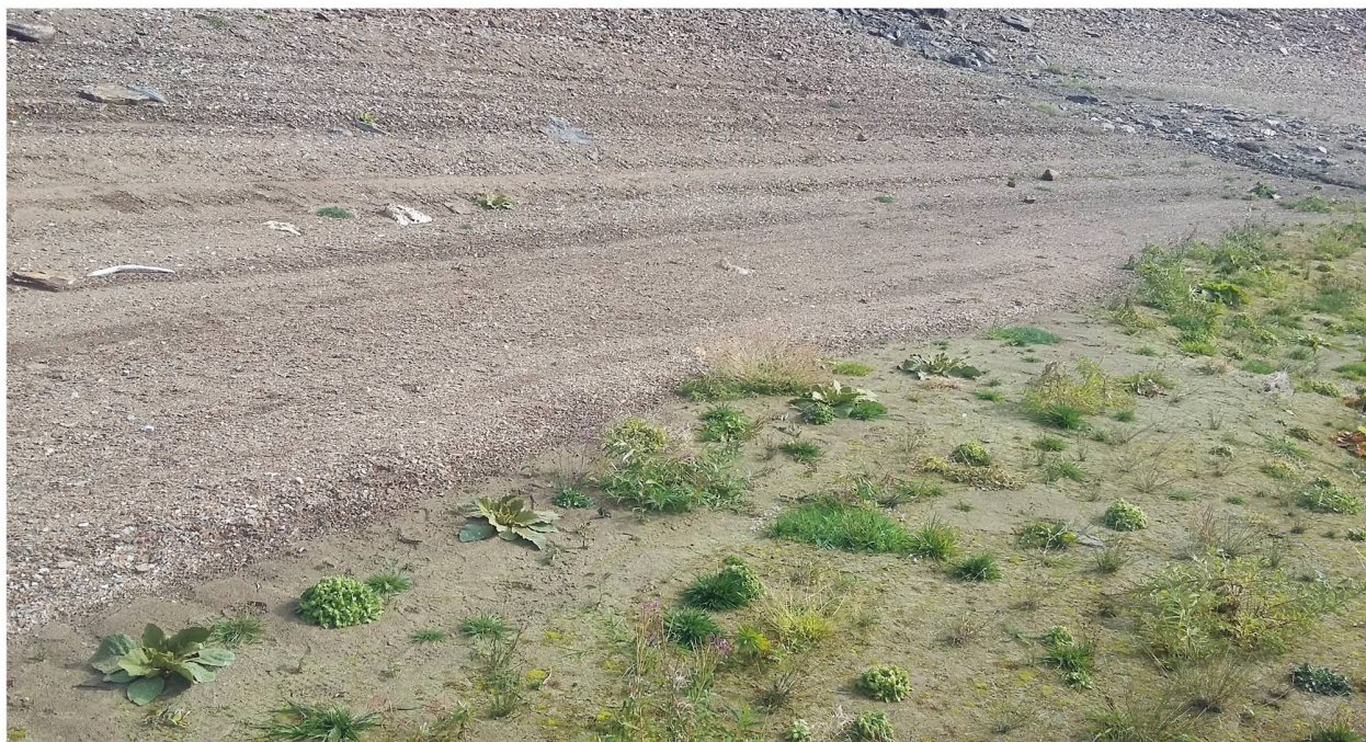
Figura 3: Nella foto è visibile il rinverdimento più intenso nella parte inferiore del Delta, in particolar modo sulla fascia litorale dove la linea di separazione tra la fascia rinverditata e la fascia rimasta senza vegetazione è ben delimitata.

Malgrado il carattere parziale del rilevamento va comunque segnalato che la parte bassa del Delta, in prossimità dello specchio lacustre, ha avuto un rinverdimento più intenso rispetto alla parte superiore (Fig. 3). I dati in nostro possesso non ci permettono di