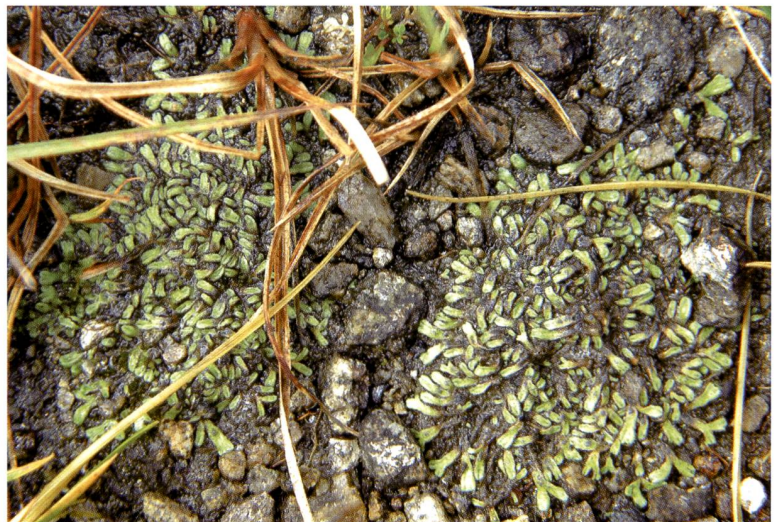
Fig. 5 – Riccia breidleri , una rara epatica iscritta nella Lista Rossa con il grado VU (vulnerabile) e protetta in tutta la Svizzera, è presente in Val Piora nei laghetti di Giübün e Taneda.