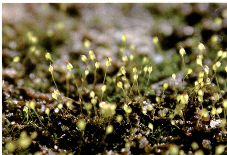
Fig. 1 – Rocce e pietraie di natura calcarea in prossimità del Pizzo Colombe: un ambiente di grande interesse per la flora di briofite calcifile della Val Piora.