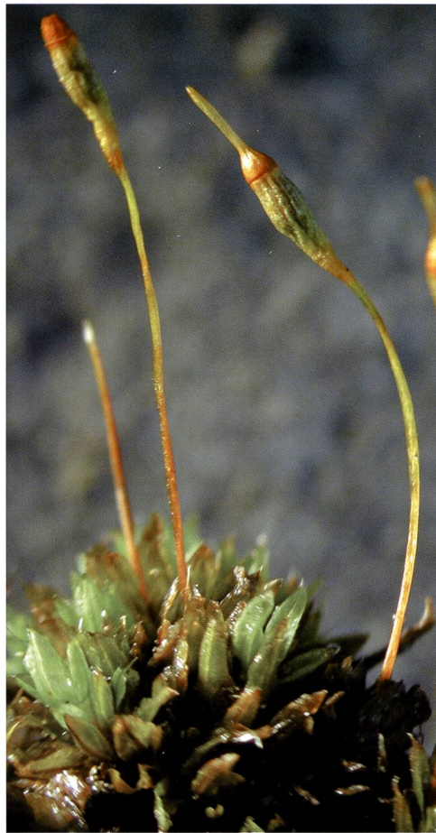
Fig. 4 – Encalypta longicolla , rilevata sulle pendici del Pizzo Colombe a oltre 2400 m s.l.m. Si tratta di una specie iscritta nella lista Rossa con il grado CR (in pericolo d'estinzione) e della prima segnalazione per il Ticino.