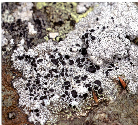
Fig. 5 – Tephromela atra (Huds.) Hafellner. I grandi apoteci a disco nero su tallo bianco-grigio possono essere d'aiuto per giungere alla diagnosi corretta. L'esame al microscopio è necessario.