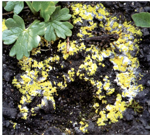
Fig. 1 – Fulgensia bracteata (Hoffm.) Räsänen. Lichene terricolo. Malgrado il brillante colore giallo spesso misconosciuto, poiché il suo tallo è di dimensioni modeste e si "nasconde" tra fili d'erba e piante alpine nane.