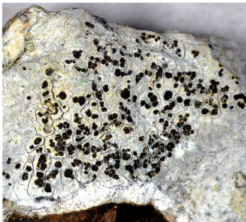
Fig. 3 – Bellemerea alpina (Sommerf.) Clauzade & Cl. Roux. Uno dei molti licheni epilittici dal colore bianco-grigiastro. Per la sua determinazione è indispensabile l'uso del microscopio.