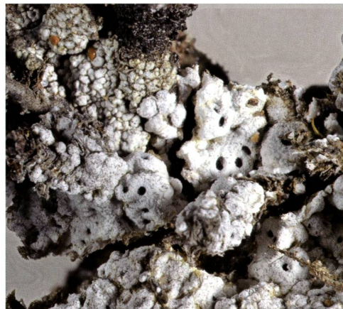
Fig. 4 – Aspicilia verrucosa (Ach.) Körb. Lichene terricolo-lignicolo. Spesso nascosto tra muschi e rami di piante alpine nane, sfugge all'occhio del ricercatore non esperto di questi licheni relativamente frequenti in zona alpina.