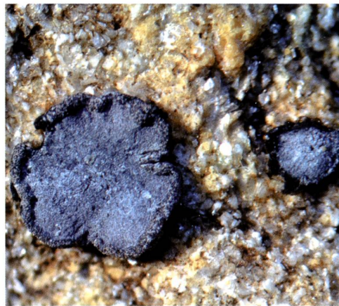
Fig. 2 – Sarcogyne regularis Körb. Lichene epilittico. Di esso sono ben evidenti gli apoteci. Il tallo si disperde tra i cristalli del sasso che lo ospita.