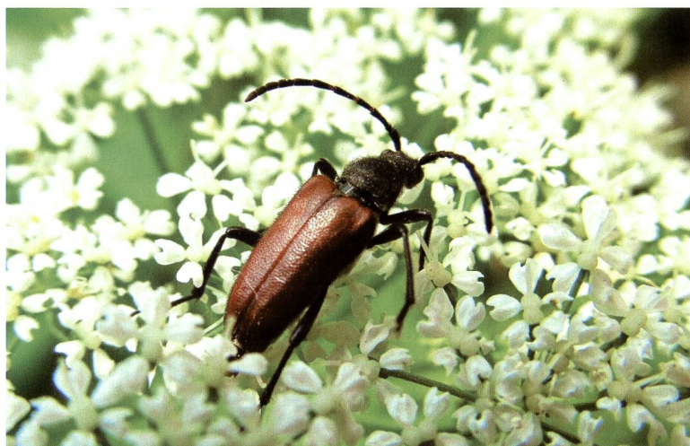
Fig. 1 – Corymbia maculicornis (ssp. simplonica ?): specie ampiamente diffusa in Europa centrale e settentrionale anche a bassa quota, montana nelle regioni meridionali. La larva si sviluppa su latifoglie (betulla, faggio, quercia) e conifere (abeto, pino); adulto floricolo

le regioni alpine e subalpine. Occorre comunque sottolineare il ritrovamento di Corymbia hybrida , una specie a distribuzione molto più limitata delle precedenti e circoscritta alle Alpi centro-occidentali.