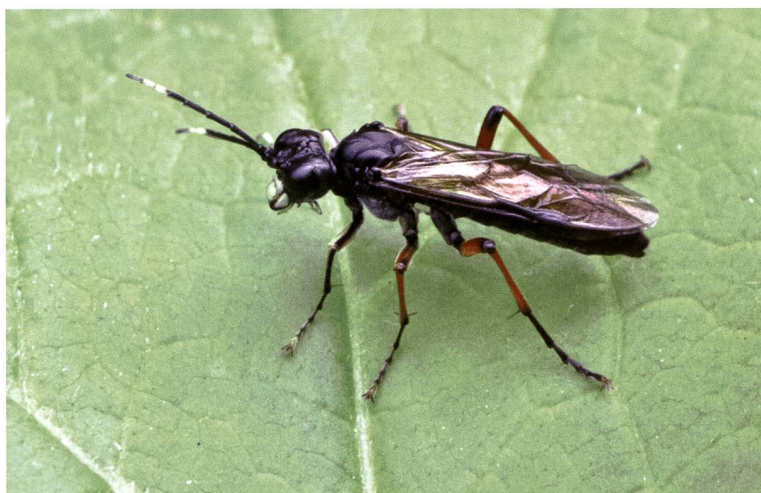
Fig. 4 – Tenthredo velox.