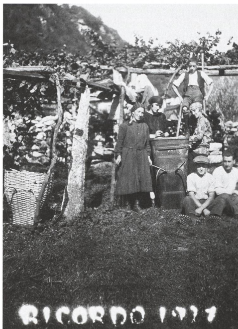
Fig. 2 – Vendemmia a Lugano nel 1911 (Centro di dialettologia e di etnografia, Bellinzona; autore non identificato).

Tab. 1 – Dati sulla produzione nel Cantone ripresi dal Conto-reso del Consiglio di Stato della Repubblica e Cantone del Ticino per l'amministrazione dello Stato dal 1° gennaio al 31 dicembre 1890, Bellinzona, Tipolitografia cantonale, 1891, p. 417 (Castagnola, 2015). (n. = numero; q = quintali; hl = ettolitri).