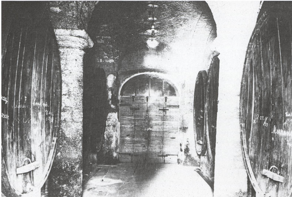
Fig. 3 – Una cantina nel Mendrisiotto negli anni Venti del Novecento.

Dopo la prima guerra mondiale, il Consiglio federale, nell'ottobre 1920, assegna il Ticino, per quanto concerne la ricerca viticola, alla Stazione agricola federale in Losanna (Castagnola, 2015). Questa importante decisione permette all'ingegner Giuseppe Paleari (1880-1955) – nel 1916 nominato aggiunto alla direzione della Scuola di Mezzana – di collaborare con i diversi colleghi della Svizzera romanda. Vengono subito iniziati degli esperimenti di vinificazione rigorosamente scientifici per stabilire le varietà, che, nelle condizioni di clima e di terreno ticinesi, possano fornire, non soltanto un raccolto normale ma soprattutto un prodotto di qualità, unico mezzo per rialzare le sorti del settore viticolo. Le ricerche dovrebbero dimostrare che alcuni vitigni italiani e francesi sono capaci di fornire degli ottimi prodotti incontestabilmente superiori alle varietà nostrane comunemente coltivate.