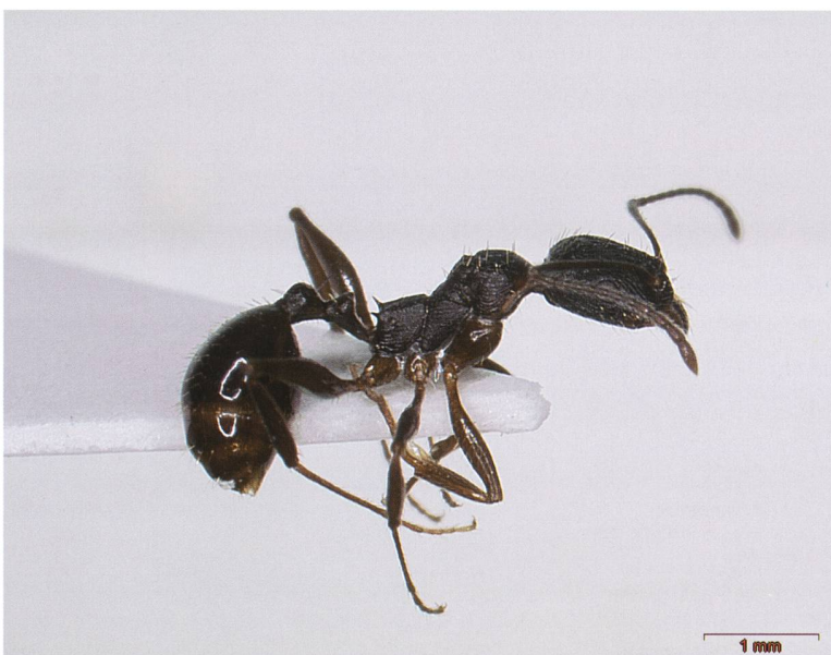
Fig 4 – Operaia di Aphaenogaster italica , osservata nel 1996 al Monte Caslano (BD Formicidae e SdA) e campionata in uno dei vigneti; si nota il corpo opaco.

Nei vigneti del Canton Ticino sono state rilevate 21 specie di formiche (Tab. 1) iscritte nella Lista Rossa delle specie minacciate di estinzione in Svizzera (Agosti & Cherix, 1994) corrispondenti al 36% delle specie totali campionate. Messor structor è considerata "in pericolo di estinzione"; tre specie sono "fortemente minacciate di estinzione": Chalepoxenus muellerianus , Plagiolepis xene e Strongylognathus cf. alpinus ; nove specie risultano "minacciate di estinzione": Aphaenogaster subterranea , Anergates atratulus , Formica pratensis , F. sanguinea , Myrmica specioides , Polyergus rufescens , Strongylognathus testaceus , Temnothorax interruptus e T. parvulus e altre otto specie sono ritenute "potenzialmente minacciate": Aphaenogaster italica (Fig. 4), Bothriomyrmex corsicus (Fig. 10), Formica gages , Hypoponera eduardi , Plagiolepis pygmaea , P. vindobonensis , Stenammas striatulum e S. zanoi . Facciamo comunque notare che