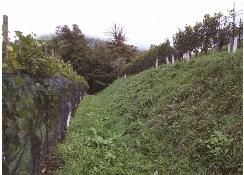
Fig 1 – Vigneto a Rovio (Basso) con scarpate e bosco a margine.

Sebbene nell’ambito del progetto BioDiVine siano state utilizzate quattro differenti tecniche di cattura (vedi Trivellone et al., 2016 per la descrizione dettagliata dei metodi), soltanto le trappole a caduta (Barber) si sono dimostrate le più adatte per un’analisi quantitativa delle comunità mirmecologiche dei vigneti ticinesi. Al centro di ogni vigneto due stazioni Barber sono state collocate a circa 20 m tra loro e almeno a 30 m di distanza dai filari periferici. Ogni stazione consisteva di quattro bicchieri in plastica (200 ml; diametro 7 cm) interrati fino all’orlo e posti a circa 1 metro l’uno dall’altro, contenenti una soluzione salina satura