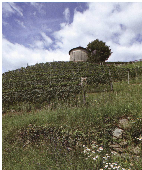
Fig 8 – A sinistra: vigneto a Camorino (Comelina) in cui è stata campionata Chalepoxenus muellerianus , specie parassita di Temnothorax spp. che utilizza muri a secco come habitat; in questo caso parassita di T. unifasciatus . C. muellerianus è segnalata anche al Monte Caslano (BD Formicidae SdA). A destra: vigneto a Camorino (Montagna) con diverse strutture come scarpate, muretti a secco e rocce affioranti, in cui sono state campionate diverse specie di valore ecologico, tra cui Pyramica argiola , Plagiolepis pygmaea e P. vindobonensis e Strongylognathus alpinus segnalate anche al Monte Caslano e in parte al Monte San Giorgio.

no all'interno della catena trofica (Wielgoss et al. , 2014). Ciononostante alcune pratiche agricole, quali la meccanicizzazione della gestione, il livellamento del terreno e l'eliminazione dei mucchi di sassi, possono influenzare significativamente l'abbondanza e la diversità delle comunità mirmecologiche, che, costituendo nidi fissi, non possono evitare disturbi (Agosti & Cherix, 1994; Steiner & Schlick-Steiner, 2002); tale effetto è molto più marcato nelle coltivazioni annuali rispetto a quelle perenni (Lobry de Bruyn, 1999).