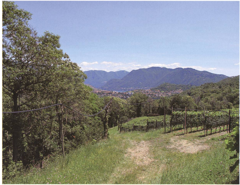
Fig 2 – Vigneto a Chiasso (Pedrinate) con margine boschivo e fasce erbose.

L' analisi delle variabili che influenzano le comunità mirmecologiche è stata effettuata utilizzando tecniche multivariate. La variabile risposta di partenza è definita dalla matrice di comunità composta da 57 specie e 48 siti. Ognuna delle cinque tipologie di variabili ambientali è stata sottoposta ad analisi della selezione progressiva ( Forward selection , 9999 permutazioni e soglia di p = 0.05 ; Blanchet et al. , 2008; Dray et al. , 2007) allo scopo di selezionare le variabili che spiegano una significativa porzione della varianza della comunità di formiche. A tale scopo è stata utilizzata la funzione packfor dell'omonimo pacchetto in R. Infine, l'analisi della ridondanza (RDA) è stata utilizzata quale tecnica di ordina-