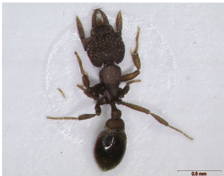
Fig 9 – Operaia di Pyramica argiola ; si notano le mandibole dentellate atte alla cattura di collemboli; osservata nel 1996 sul Monte Caslano (BD Formicidae e SdA) e recentemente in diversi vigneti indagati.

forniscono proteine sclerotizzanti (Holldobler & Wilson, 2005). L. emarginatus svolge quindi un lavoro ecosistemico importante intrattenendo proficue associazioni mutualistiche con altri organismi.