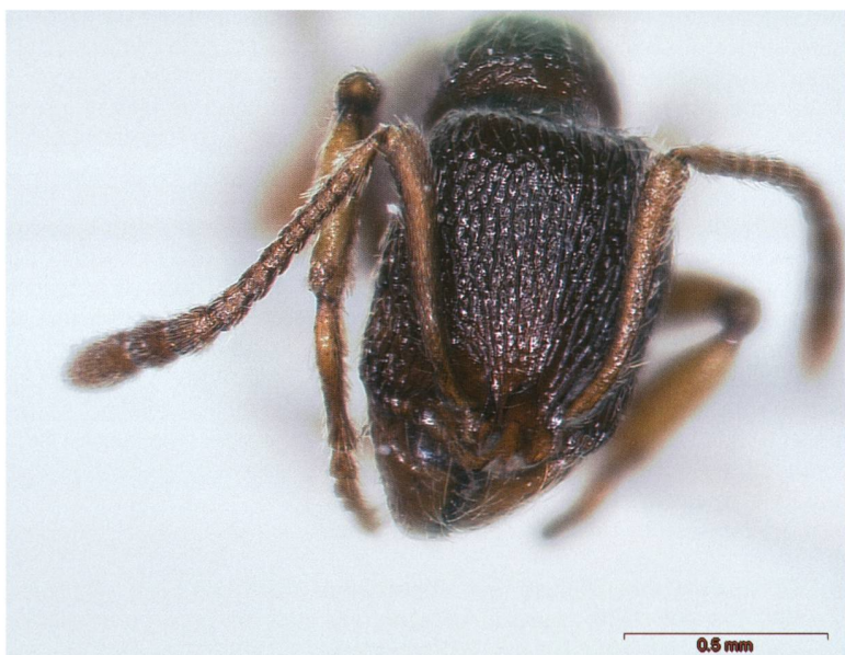
Fig 7 – Operaia di Stenamamma zanoni ; si nota che la lunghezza dello scapo raggiunge il bordo della testa; osservata recentemente in castagneti del Malcantone e del Locarnese (BD Formicidae e SdA) e campionata in uno dei vigneti.

Nell'ambito di questo studio M. structor è stata campionata principalmente nel Mendrisiotto e in un vigneto del Sopraceneri. In Svizzera risulta in pericolo di estinzione (Agosti & Cherix, 1994), ed è segnalata solo nel Ticino meridionale e nella valle del Rodano fino a Ginevra (Kutter, 1977). Il numero elevato di operaie per nido (Blatrix et al., 2013) ne spiega l'abbondanza locale. Essendo essenzialmente granivora, M. structor colonizza ambienti aperti ben esposti come prati secchi estremamente xerotermi con una flora in grado di produrre un elevato numero di semi (Seifert, 2007). I vigneti in cui è stata rilevata sono caratterizzati da scarpate sassose difficili da falciare e quindi presumibilmente con una grande disponibilità di semi. P. pallidula è una specie mediterranea (Kutter, 1977), presente in Svizzera solo al Sud delle Alpi, dove raggiunge il limite del suo areale di distribuzione (Agosti & Cherix, 1994). Tale specie è stata campionata sia nel Sopraceneri che nel Sottoceneri (BD