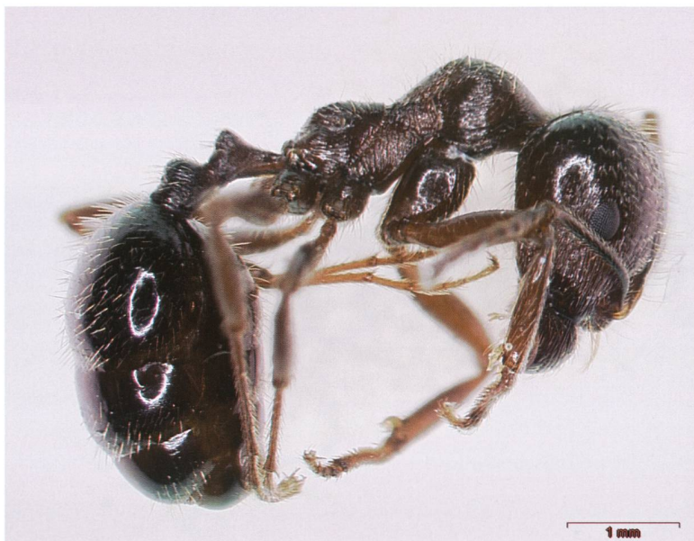
Fig 6 – Operaia di Messor structor ; si nota il propodeo senza spine; osservata recentemente a Coldrerio (BD Formicidae SdA) e in alcuni vigneti studiati.