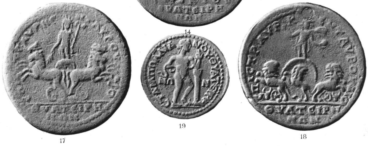
SILANDOS TABALA THYATEIRA.