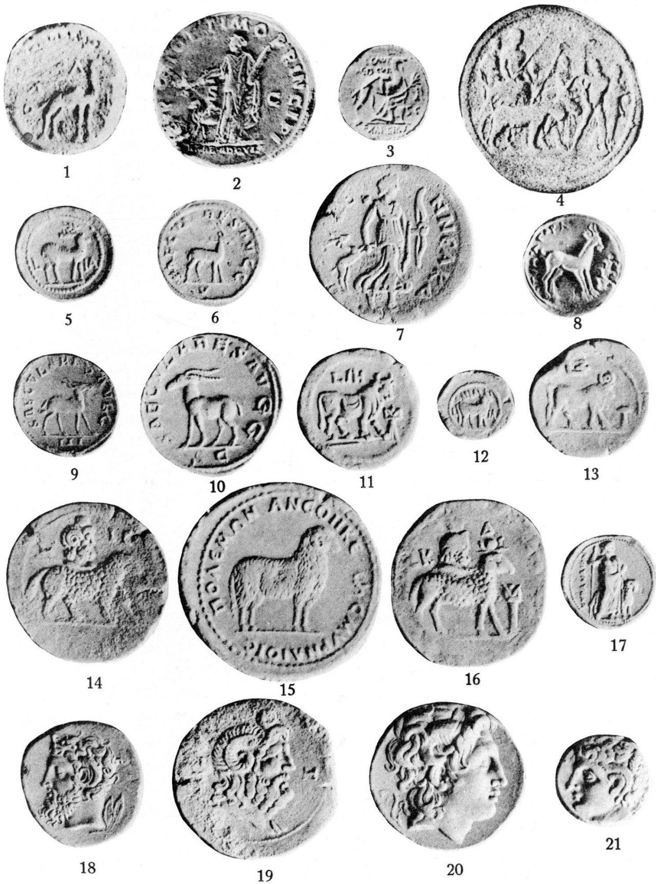
Säugetiere (Kamel bis Widder)