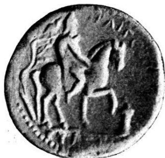
Abb. 6. Mithras zu Pferde (Grossbronze aus Trapezus).