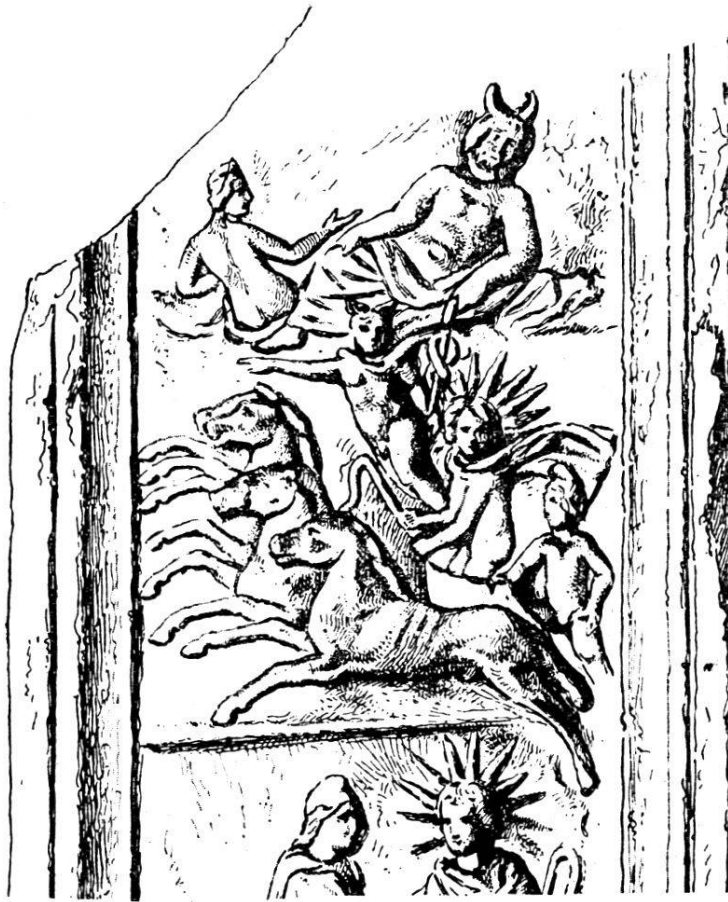
Abb. 7. Mithras und Sol im Sonnenwagen. Teil eines Marmor-Reliefs in Klagenfurt.

Im Gegensatz zum Entwicklungsgange des Sarapis-Kultus, für welchen uns die Numismatik die Hauptaufschlüsse gibt, dienen zur Erforschung des Mithras-Kultes in chronologischer, wie in topographischer Hinsicht, hauptsächlich architektonisches, statuarisches und epigraphisches Material, worunter namentlich die in den Mithräen gefundenen Reliefs zu nennen sind.