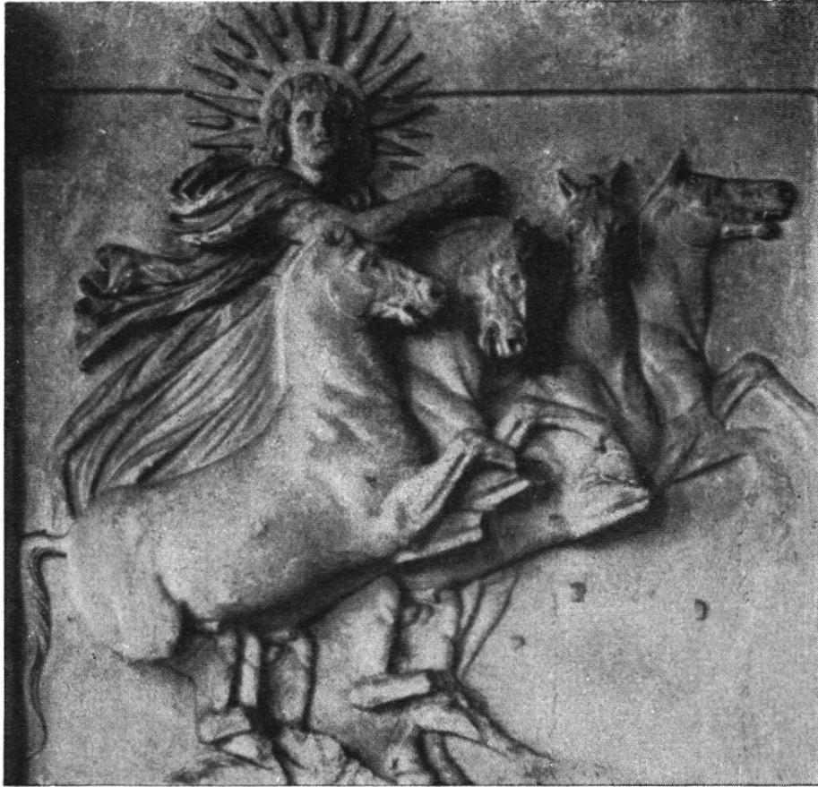
Abb. 11. Helios-Metope vom Athena-Tempel zu Ilion, in Berlin. Um 300 v. Chr.

Darstellung soll den Sonnenaufgang symbolisieren. Morgens verlässt Helios den Okeanos „aus des tiefergossenen Okeanos ruhiger Strömung steigend am Himmel empor“ (Hom. Jl. VII, 422). Sie begegnet uns ebenso auf Münzen. Bald sieht man das Gespann von der Seite, wie es die Himmelsbahn durchzieht, bald von vorne heranstürmend, einmal auch mit Löwen statt mit Pferden bespannt.