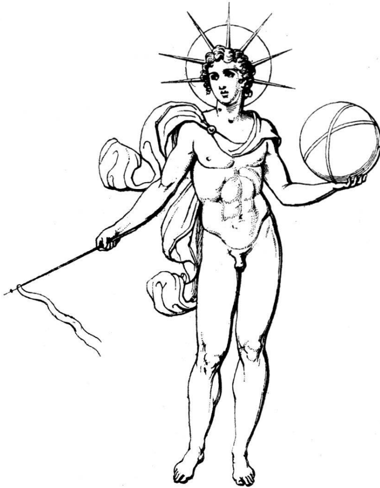
Abb. 10. Helios, nach einem pompejanischen Wandgemälde.

Auf einer unter Nerva (96—98) geprägten Grossbronze von Rhodos sehen wir den linkshin stehenden Helios mit Strahlenkranz und Gewand, die Peitsche in der Linken, einer weiblichen bekleideten Gestalt die rechte Hand reichend (T. II, 11). Auf dieser Münze des Nerva erscheint zum ersten Mal der Helios in ganzer Figur ) 26) . Auf Kupfermünzen hauptsächlich kleinasiatischer Städte, wo der Helioskult damals blühte, sind ferner folgende Varianten des stehenden Helios mit Strahlenkranz zu verzeichnen: der Gott hat in der Rechten eine Fackel und in der Linken die Weltkugel, Kolossai in Phrygien, zirka 200 nach Chr. (T. II, 12), oder er hält, die freie Rechte erhebend, in der Linken die Weltkugel, Nysa in Lydien, Vs. Gallienus, 253—268 (T. II, 13),