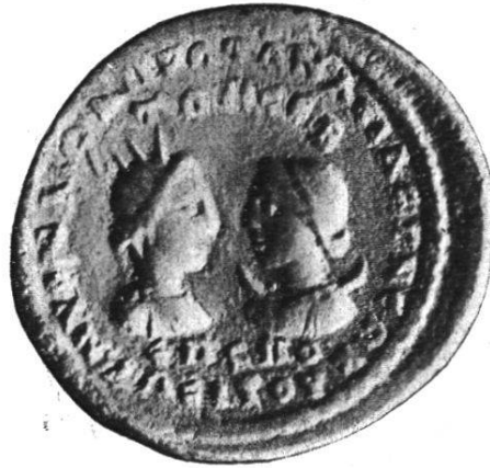
Abb. 8. Severus Alexander und Orbiana (Grossbronze).

(359—336 v. Chr.), T. II, 6 und Alexanders des Grossen (336—322 v. Chr.), dann auf einem athenischen Tetradrachmon um 200 v. Chr. (T. II, 7), ferner auf einem Tetradrachmon des oben S. 249 genannten Syrerkönigs Antiochos IV. und auf der bereits S. 250 erwähnten Billonmünze der römischen Provinz Syria (T. II, 8); sodann auf Cistophoren (2. Jahrhundert v. Chr.) z. B. auf einem von Ephesos (meine Sammlung), und auf einem der wiederholt genannten Stadt Tralleis, woselbst neben dem des Zeus der Kult des Apollon, des Helios und der Selene eine grosse Rolle spielte, was sich auf den Münzen der Stadt abspiegelt.