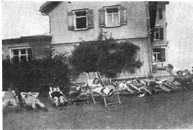
«Siesta» der jungen Holländer

Es kamen aber auch andere Menschen zu uns, solche, die Kriegsnot und das ganze namenlose Kriegselend erlebt hatten. Es kamen bleiche, magere Kinder aus Holland, die aus leeren und freudlosen Augen einem fragend anschauten. Eine schöne