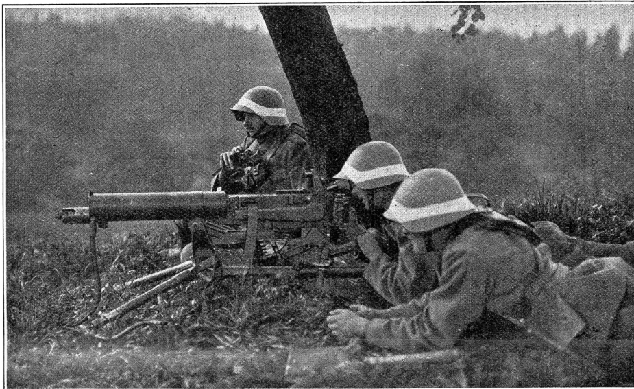
Maschinengewehre in Stellung.