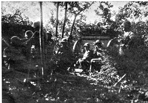
Artillerie in gedeckter Stellung.

Der Manöverbeginn war nebst unserer « Beinebewegung » das Interessanteste, was wir Sandhasen im Dienst miterlebt haben. Wir marschierten auf der rechten Seite der Strasse und befanden uns auf dem « Laufplatz » (sonst würde man Stehplatz sagen) eines Riesenkinos. Wir hatten zunächst nichts zu tun, als zu laufen und konnten in aller Ruhe das betrachten, was alles an uns, wie im Wildwestkinotempo, vorbeiraste. Zuerst sprengten Kavalleristen neben uns vorbei an die