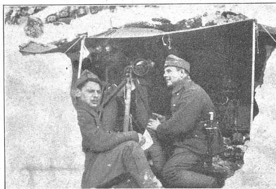
Signalstation im Schnee.

Donnerstag, 6. Oktober. Détailtag. Nun kommen die Tel.-Kanoniere auf ihre Rechnung, indem sie mit ihrem Karabiner, für welchen viele im Friedensdienst nicht den eigentlichen Zweck erkennen können, ihre Kunst erproben durften. Es ist auch ganz richtig, dass jede Waffe mindestens einmal pro Jahr in diesem Sinne mit dem Mann geprüft werden soll. Geschossene Resultate zeigen dies oft nur zu gut. Wie in allen solchen Fällen fehlt es oft nur am nötigen Verständnis und etwas mehr Anleitung, wodurch mit mehr Liebe zur Sache zum mindesten das erreicht werden kann, was nur recht und billig ist.