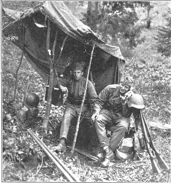
Telephon beim Artillerieschiessen. Le téléphone pendant le tir d'artillerie.

Mit der Bekanntgabe durch das Kurstableau pro 1927 setzte schon reges Interesse unter den «Haubitzen» ein für den Wiederholungskurs im Gebirge. Gewiss hat sich mancher zweimal überzeugt, ob es wirklich heisst: «Korpssammelplatz Andermatt». Es ist natürlich auch verständlich, denn nicht jedem war es sogleich klar, dass die Feld-Haubitzbatterien auch einmal