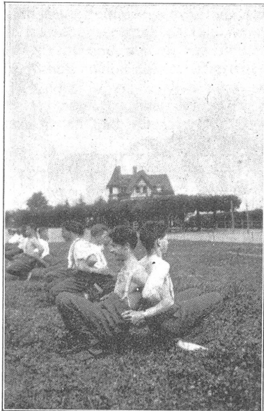
Wagen in Rückenstellung.

lande Bürger wohnen, die gewillt sind, weder Zeit noch Mühe zu sparen, um an der Ertüchtigung unserer Jugend und damit an der Festigung unseres Vaterlandes nach innen und nach aussen mitzuhelfen. Es ist das heute vielleicht notwendiger denn je; heute, wo ihrer Verantwortung unbewusste Schwätzer an jahrhundertealten und bewährten Einrichtungen des Staates rütteln und dadurch die stetige Weiterentwicklung unseres Volkes gefährden.