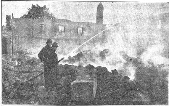
Das brennende Zeughaus in Freiburg. (Carl Jost, Bern.)

ir muesst noch von in lehren, bei in zu schuole gon, wett mit euch umb ein kron!