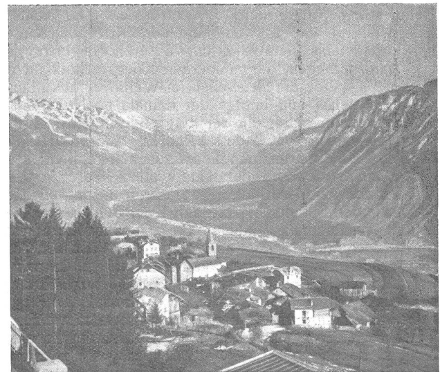
Panorama vom Sanatorium aus.

Zu dieser schönen Lage gesellt sich ein äusserst günstiges Klima. Das Wetter ist hier sehr beständig.