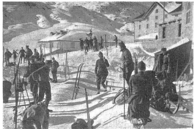
Vor der Abfahrt auf Gotthard-Hospiz. Avant le départ pour l'hospice du St-Gothard.

Die nachfolgenden Arbeitstage, die leider nicht von schönem Wetter und guten Schneeverhältnissen begünstigt wurden, waren sehr streng und wurden bis auf die Minute gut ausgenützt. Die Normaltagesordnung für alle Klassen war ungefähr folgende: