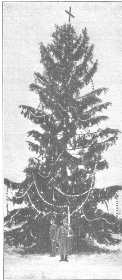
Weihnachten 1914. — Noël 1914. (Gallas, Zürich)

Man sah in grossen Haufen Grosse und schwere Säcke ankommen, Und man dachte mit einer Grimasse, Dass in allen Reis wäre.