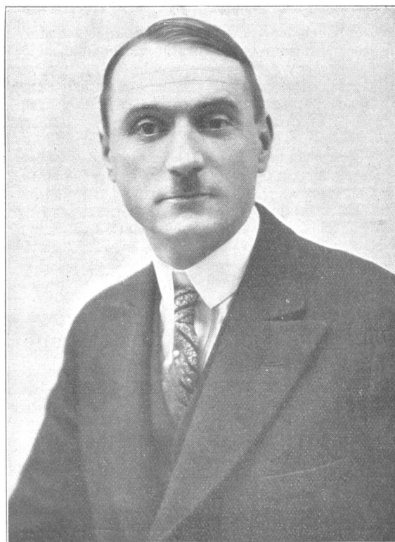
Der neugewählte Bundesrat Dr. M. Pilet. Le nouveau conseiller fédéral Dr. M. Pilet.

«Was wir heute brauchen, ist also nicht nur nicht Abrüstung, sondern Aufrüstung, vor allem moralische. Nach den Erfahrungen des Weltkrieges und unserer