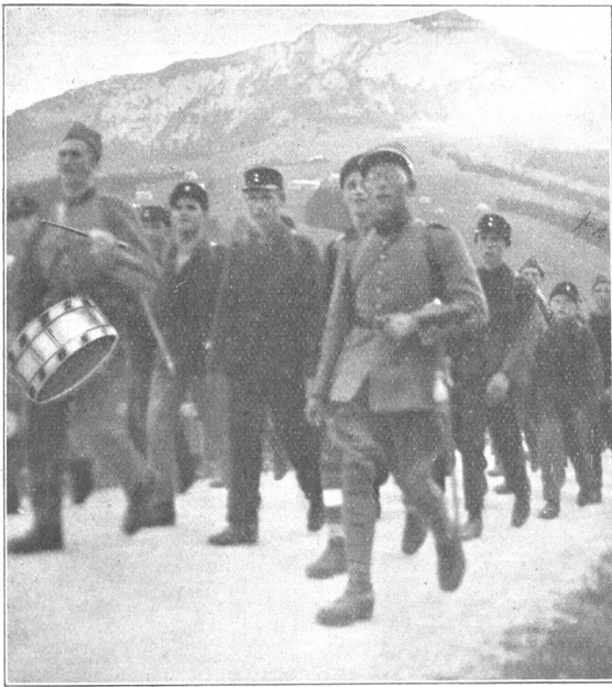
Jungwehr-Ausmarsch. — Moblots en marche.