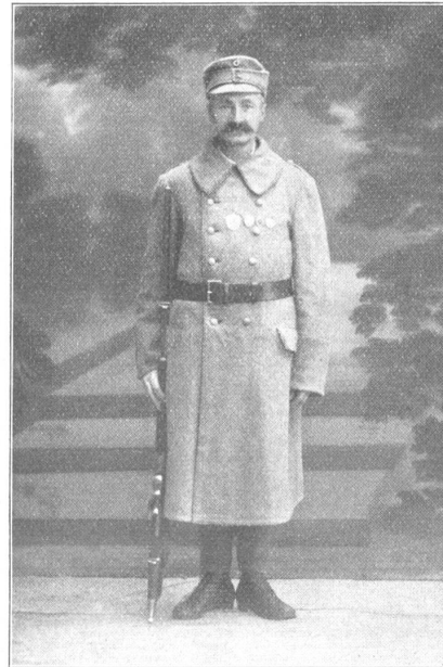
Huvi Tuiskunen, erster finnländischer Meisterschütze im Jahre 1907. Huvi Tuiskunen, premier maître-tireur finlandais en 1907.

«Ah! la belle Escalade, Savoyard, Savoyard!»