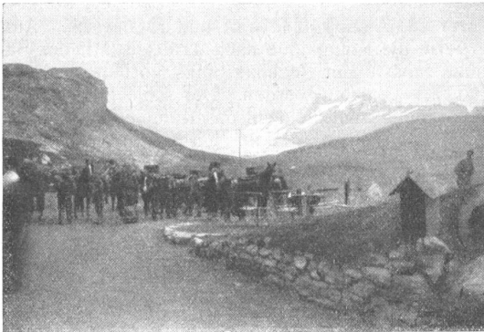
Auf der Frutt.

Auf dem Mobilmachungsplatz Eichwald bei Kriens herrschte am 20. August 1928 reges Leben. Morgens um 7 Uhr wurde durch das Matr.-Fass.-Det. das Korpsmaterial gefasst. Der ganze Vormittag diente zum Erstellen der Marschbereitschaft, die um 13.00 beendet war. Bei der Einschätzung der Pferde stellte sich heraus, dass wir ausnahmsweise sehr gute Tiere erhielten. Allerdings waren alle Pferde mit sehr schlechtem Sommerbeschlag eingerückt, was uns diesmal weniger ärgerte, da ja sowieso für den ausgesprochenen Gebirgsdienst die Beschläge geändert werden mussten. Damit nun durch