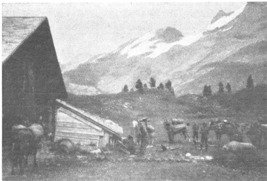
Holzbasten auf der Engstlenalp. Le bât est utilisé pour le transport du bois sur la Engstlenalp.

Der 26. August war programmgemäss zu Bergtouren frei. Die Offiziere und 30 Soldaten der Kompagnie planten die Besteigung des Titlis. Er hatte schon lange lockend auf uns heruntergeschaut mit seinen prächtigen Umrisslinien, dem felsigen Gipfel und den leuchtenden Gletschern. Leider regnete es um 2.00, als man aufbrechen wollte. Um 9.00 heiterte es auf, so dass wir Offiziere uns rasch entschlossen, doch noch den Titlis zu besteigen. Es lohnte sich unser Entschluss tausendfach. Wir hatten bald wunderbares Wetter. Der Aufstieg über Matten, dann über Schutt und Geröll und Gletscher war sehr abwechslungsreich und kurzweilig. Und je höher wir stiegen, desto mehr silberne Zacken und Spitzen hoben sich in blauer Ferne über den Horizont empor. Und oben auf dem Gipfel hatten wir eine ganz feinergliederte Krone von Bergen um uns. Wir erlebten wieder einmal so recht den unvergleichlichen Anblick der Hochgebirgswelt. In der Nähe die massigen Flächen des Schnees neben grauen Köpfen und Schutthängen, dann