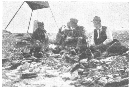
Auf dem Titlis.

Der 28. August war kalt und regnerisch. Am 29. dislozierte die Kompagnie nach Trübsee. Mit der Saumkolonne musste der Jochpass tags vorher zweimal hin und zurück gemacht werden. Der schlechten Witterung wegen konnte man nicht an das Kampieren denken, wie geplant war. Beim Rückmarsch am 29. nach Trübsee regnete es wieder unerbittlich. Ohne Zwischenfall gelangten wir aber ans Ziel und bezogen Kantonnements