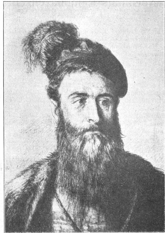
Hans Waldmann, gest. 6. April 1489 (mort le 6 avril 1489).

Oberstleutnant Zuber hat an das am Dienstag entlassene Regiment folgenden Schlussbefehl gerichtet: «Es ist mir eine Freude, der Truppe mitteilen zu können, dass die guten Leistungen des Regiments im Wiederholungskurs von meinen Vorgesetzten voll anerkannt wurden. Im Ordnungsdienst hat das Regiment durch seine flotte, stramme Haltung Eindruck gemacht.»