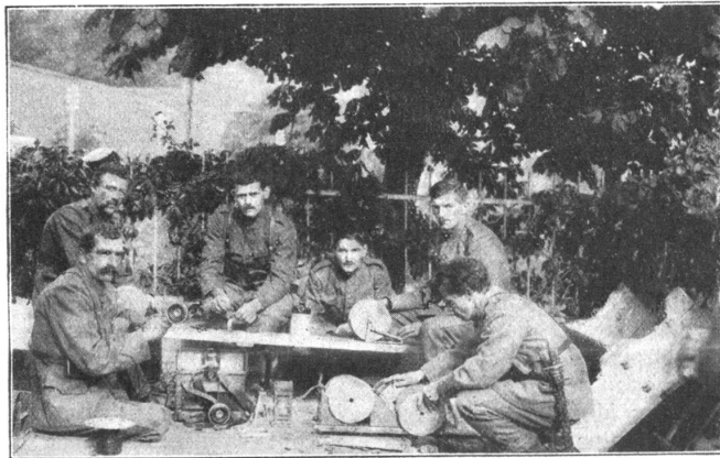
Service de parc des téléphonistes.