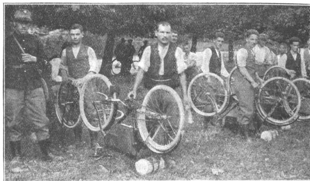
Radfahrer bei Reinigungsarbeiten. Cyclistes; travaux de nettoyage.