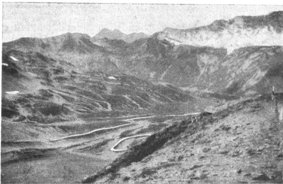
Oesterreichische Schützengräben auf Dreisprachenspitze. Tranchées autrichiennes sur la „Dreisprachenspitze.“

Er, der Inbegriff eines Soldaten, eines Helden, der freudig gewillt ist, seinem Vaterlande bis zum letzten Atemzuge zu dienen — er ein Ueberläufer?