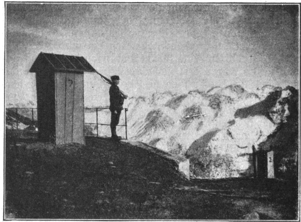
Posten auf Dreisprachenspitze. Un poste sur la «Dreisprachenspitze».

Das ging so weiter dort unten und bald wagten es auch noch andere Kaiserjäger, dem Beispiel zu folgen.