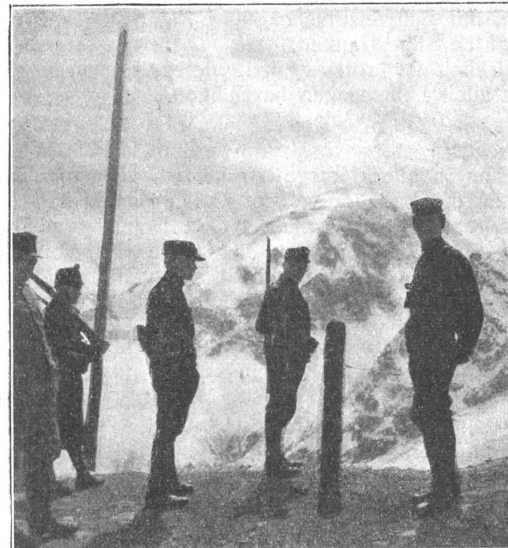
Oesterreichische und schweizerische Grenzschutz auf Dreisprachenspitze. Gardes-frontières autrichiens et suisses sur la „Dreisprachenspitze“

Droben auf dem Dreisprachenspitz wurde der Gedanken- und Tauschhandel plötzlich österreichischerseits beinahe lahmgelegt. Eines Abends erschien ein schmucker