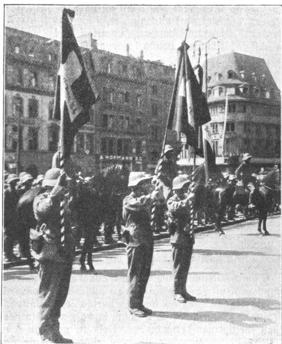
Fahnenübergabe des Basler Infanterie-Regiments. La remise des drapeaux au régiment bâlois.

ihres Betriebes folgende ab 1. Januar 1929 gültig gewordene Bestimmungen erliess: Wenn die Dauer des Militärdienstes einen Monat nicht überschreitet, so werden die Ferien unverkürzt gewährt. Bei länger andauerndem Militärdienst wird die Hälfte der Ferien mit dem Dienste verrechnet. Die gleiche Ordnung gilt auch für die Angestellten. In bezug auf die Belohnung hat die Firma folgende Bestimmung getroffen: Arbeiter erhalten bei Erfüllung der ordentlichen Militärdienste (Rekrutenschulen, Wiederholungskurse), wenn sie ledig sind, 35%, bei nachgewiesener Unterstützungspflicht 50% ihres Lohnes. Verheiratete Arbeiter erhalten eine Entschädigung von 50% und für jedes Kind einen Zuschlag von 10%, und zwar bis zur Höchstgrenze von 100% des Normallohnes. Die gleiche Vergütung wird durch die Direktion in der Regel auch bei weiteren Diensten (Unteroffiziersschule, Abverdienen) gewährt. Die Angestellten haben volle Gehaltsvergütung, wenn die Dienstzeit einen Monat nicht übersteigt, im andern Falle aber erhalten sie 50% des Gehaltes. («N. Z. Ztg.»)