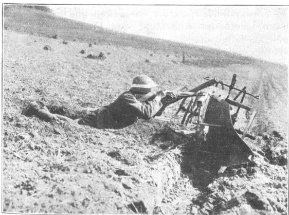
Ist das richtig? — Est-ce juste? (M. Kettel, Genf.)

Wie bereits bekannt ist, wird die 6. Division dieses Jahr einen Manöver-Wiederholungskurs abhalten, und zwar vom 26. August bis 7. September. Die Artillerie rückt am 23. August ein. Wie wir vernehmen, wird im Vorkurs der grösste Teil der Division in der Umgebung von Frauenfeld untergebracht werden. Der Divisionsstab