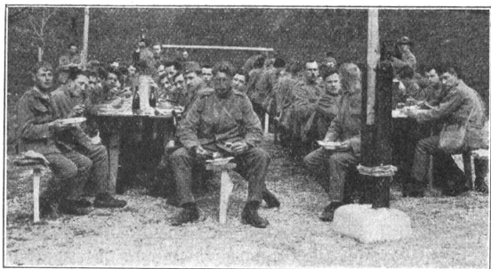
Verpflegung. (Hohl, Arch.) L'heure de la soupe.