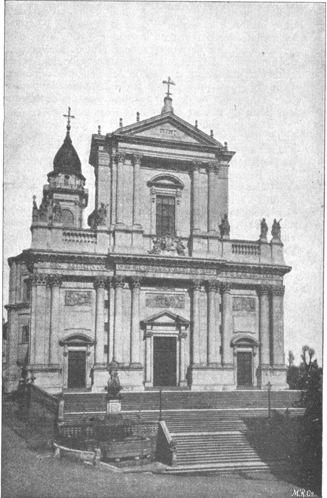
St. Ursenkirche — Fassade — Eglise St. Urs

dich leisten wir unsern Militärdienst, Gott schulden wir ein unbeflecktes Leben.» So hatten die Thebäer bei Augannum droben gesprochen, als der Kaiser sie mit Folter und Tod bedrohte, und willig hatten sie ihren Nacken dem Schwerte gebeugt und sich geweigert, trotzdem sie in grosser Zahl gewesen, mit der Waffe in der Hand gegen den Kaiser sich zu wehren. Vom gleichen Geiste beseelt, waren Ursus und Viktor und ihre 60 Gefährten, die, im Castrum Salodorese ergriffen, lieber den Tod leiden, als ihrer Pflicht untreu werden wollten. Sie wurden darum auf der Brücke, die damals