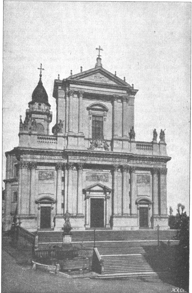
St. Ursenkirche — Fassade — Eglise St. Urs

dich leisten wir unsern Militärdienst, Gott schulden wir ein unbeflecktes Leben.» So hatten die Thebäer bei Augannum droben gesprochen, als der Kaiser sie mit Folter und Tod bedrohte, und willig hatten sie ihren Nacken dem Schwerte gebeugt und sich geweigert, trotzdem sie in grosser Zahl gewesen, mit der Waffe in der Hand gegen den Kaiser sich zu wehren. Vom gleichen Geiste beseelt, waren Ursus und Viktor und ihre 60 Gefährten, die, im Castrum Salodorese ergriffen, lieber den Tod leiden, als ihrer Pflicht untreu werden wollten. Sie wurden darum auf der Brücke, die damals