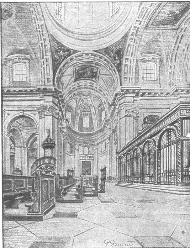
St. Ursenkirche — Inneres