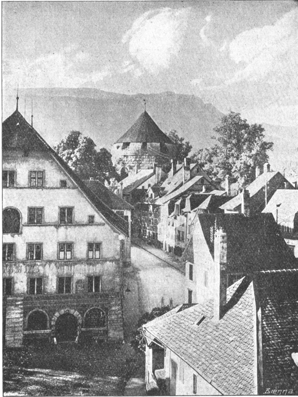
Altes Zeughaus — Vieux arsenal

«Zwanzig Jahr nach der Statt Tryer Anfang legte ein anderer von sein dess Tuiscons Helden-Fürsten oder Gesellen / mit Namen Salodor / den ersten Grund der Statt Solothurn / . . . In meines Vettern Herrn Hauptmann Anthoni Haffners geschribene Solothurnische