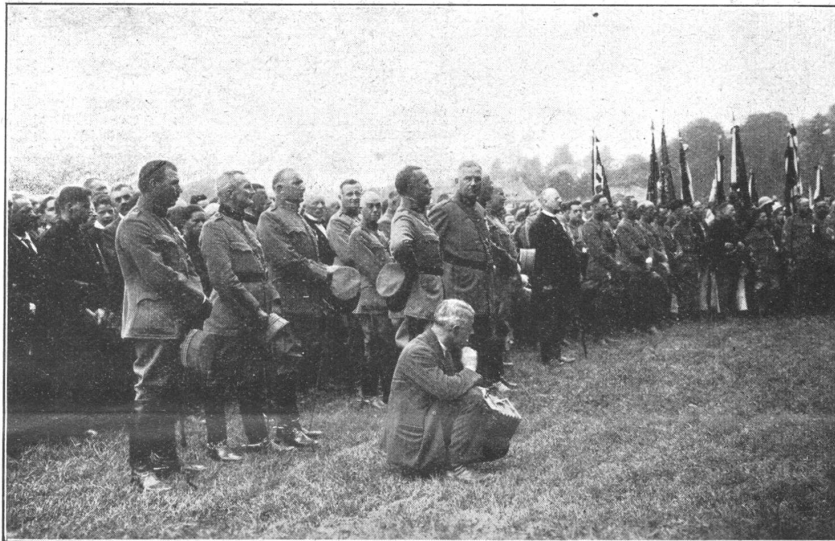
Schweizer. Unteroffizierstage — Journées suisses de Sous-officiers

Den Unteroffizieren Dank, dass sie die vaterländische Fahne hochhalten. Wohl gibt es eine Handvoll überspannter Schwarmgeister, die Gegner der Armee sind, obschon unsere ganze ausländische Politik nur dahin geht, im Frieden zu leben. Wenn wir trotzdem mit voller Ueberzeugung für Armee und Landesverteidigung eintreten, so geschieht es deshalb, weil wir gerade wegen unserer Armee als Ordnungsstaat geachtet sind