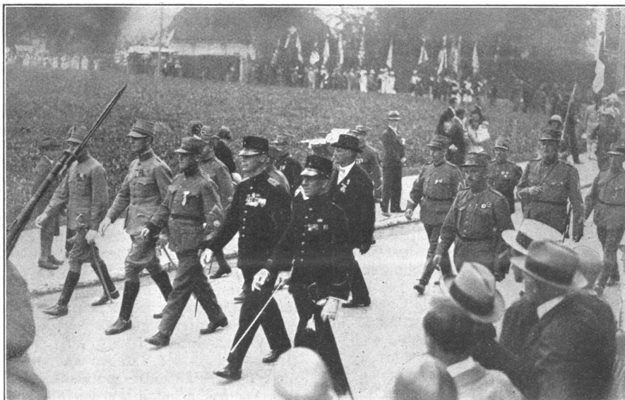
Schweiz. Unteroffizierstage — Journées suisses de Sous-officiers (Hohl, Arch.) Holländer Unteroffiziere und Zentralvorstand im Festzug — Le cortège. Sous-officiers hollandais et le comité central

Der Samstag. Die eigentlichen Wettkämpfe setzten erst am Samstag ein. Ein wohlthuendes Gewitter brachte mit dem anbrechenden Tag eine willkommene Abkühlung nach dem schwülen Freitag. Dumpf dröhnte um 5.00 Uhr der rassige Trommelschlag durch die Stadt, die Unteroffiziere zu flinker Arbeit aufmunternd. Der Himmel machte anfänglich ein recht bedenkliches Gesicht,