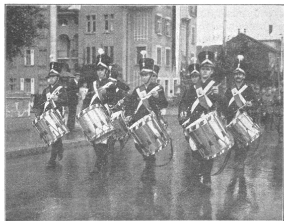
Schweiz. Unteroffizierstage — Journées suisses de Sous-officiers Festzug; Historische Gruppe — Le cortège; Groupe historique

Am Vortage der Eröffnung der schweizerischen U.O.T. 1929 fand in Solothurn die eidgen. Delegiertenversammlung statt. Schon mit den Morgenzügen rückten die Delegierten aus allen Gauen der Schweiz an, um, wenn möglich, noch am Vormittag ihre Schüsse ins oder ums Schwarze zu tun. Um 14 Uhr fanden sich die Delegationen am Bahnhof ein zum Empfang der Zentralfahne, welche mit dem Zug von Olten her eintraf. Glockengeläute und Trommelwirbel begrüssten das Banner des eidgenössischen Verbandes auf Solothurner Boden, und begleitet von einer stattlichen Anzahl Delegierter, wurden der Zentralvorstand und die Zentralfahne ins Rathaus geleitet. Festlich geschmückte Strassen und freundliche Gesichter ringsum waren uns herz-