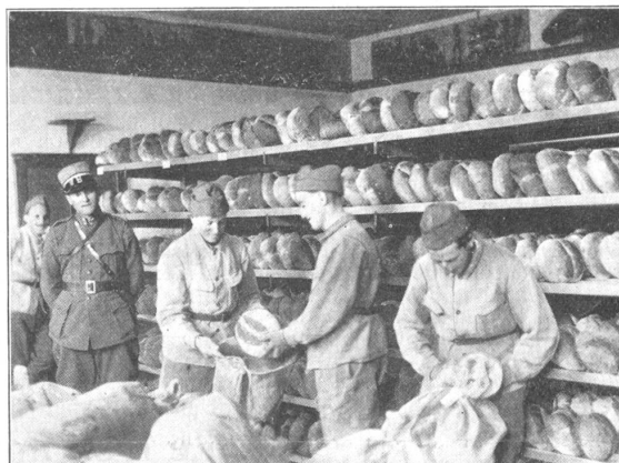
Feldbäckerei. — Das Füllen der Säcke im Magazin. Installation d'une boulangerie militaire de campagne. La mise en sac au magasin.