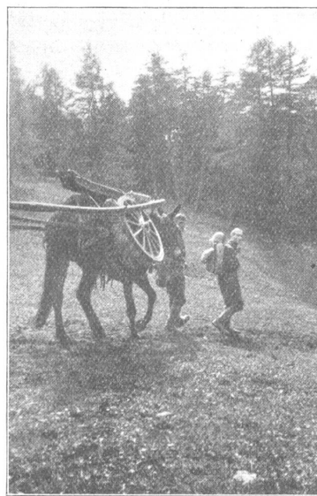
Prêt à partir

La batterie 2 quitte le Châble lundi à 15 heures et redescend à Sembrancher pour gagner Orsières où elle passera la nuit. Cette batterie est attachée au parti rouge, c'est à dire au R. I. 5 moins le bat. car. 1. La